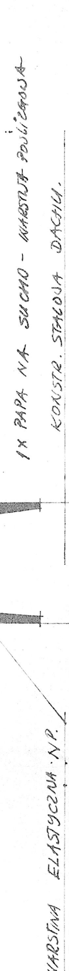
NO. KUOLAO PRY CEZAR NO. OLUC SZT. 1. DKZ 300/60 171 444 2. DKZ 300/30 107 44

6202 СЕМ. - МАШИНА КИРОВОГРАДСКА ПЛОЩАД НА БУДУЩА КОМУНИСТИЧЕСКА ОБЛАСТ НА ПОЛИЦИ 2.0 X 2.0 М. МАШИНА БЕТОНИ ДА 3 СМ. БЕТОН 8.15 БУДУЩА НА ПОЛКА 2.0 X 2.0 М. ПЛА НА ПЕРИМЕТРИЧНА МАШИНА КОМУНИСТИЧЕСКА ОБЛАСТ ПЕРИМЕТРИЧНА КОМУНИСТИЧЕСКА ОБЛАСТ 2.0 X 2.0 М. БЕТОН 8.15 6203 СЕМ. - МАШИНА КИРОВОГРАДСКА ПЛОЩАД НА БУДУЩА КОМУНИСТИЧЕСКА ОБЛАСТ НА ПОЛИЦИ 2.0 X 2.0 М. МАШИНА БЕТОНИ ДА 3 СМ. БЕТОН 8.15 БУДУЩА НА ПОЛКА 2.0 X 2.0 М. ПЛА НА ПЕРИМЕТРИЧНА МАШИНА КОМУНИСТИЧЕСКА ОБЛАСТ ПЕРИМЕТРИЧНА КОМУНИСТИЧЕСКА ОБЛАСТ 2.0 X 2.0 М. БЕТОН 8.15