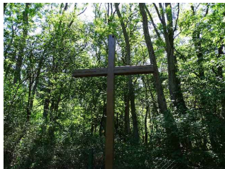
Krzyż przeznaczony do renowacji