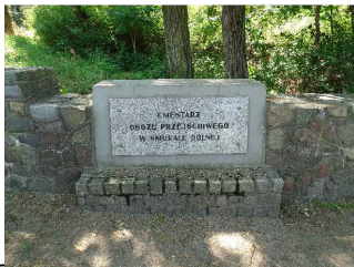
Mur przeznaczony do renowacji