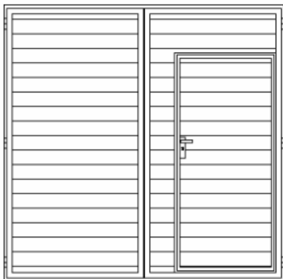
Rys. 4. Widok zewnętrzny bramy i furtki serwisowej.