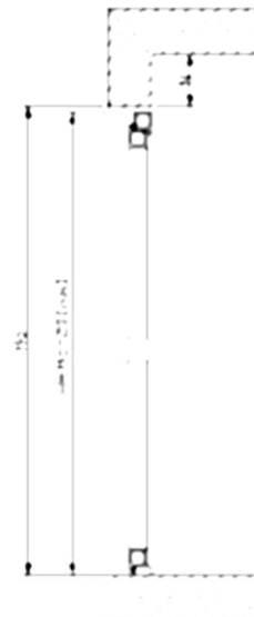
Rys. 3. Montaż bramy dwuskrzydłowej w otworze – przekrój pionowy