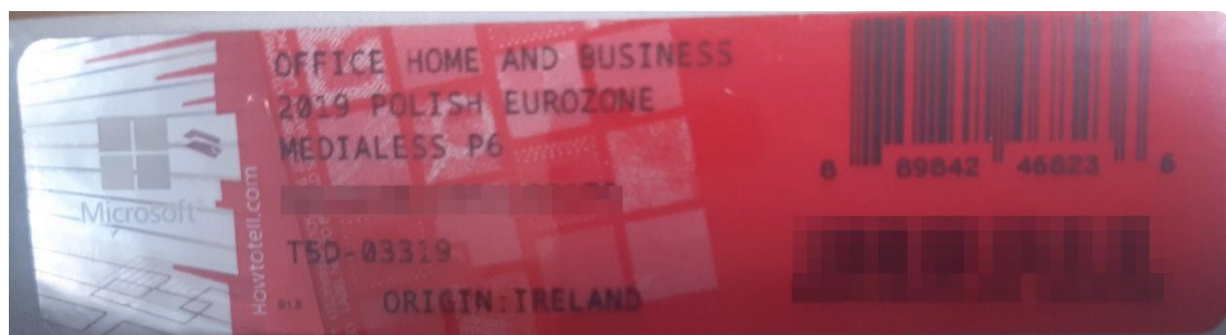
Rys. 2 przykładowy kod zabezpieczony przez producenta systemu Microsoft Windows Office Home&Business z wymazanym, znajdującym się w prawym dolnym rogu numerem seryjnym produktu. Kod licencyjny znajduje się w środku szczelnie zapakowanego i zafoliowanego pudełka (Rys. 3)