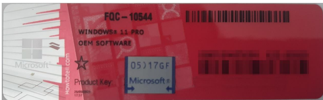
Rys. 1 przykładowy kod zabezpieczony przez producenta systemu Microsoft Windows 11 (takie same naklejki mają Windows 10) z wymazanym, znajdującym się przed i za szarą naklejką kodem licencyjnym

Poniższe zdjęcie obrazuje obecnie stosowane zabezpieczenia producenta firmy Microsoft (klucz systemu jest zabezpieczony naklejką hologramową przez producenta. Po jej zdrapaniu uzyskujemy dostęp do oryginalnego klucza):