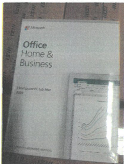
Rys. 3 Przykładowe zdjęcie pudełka dla produktu Microsoft Home&Business

Jesteśmy przekonani, że dzięki takiemu zapisowi do wzoru umowy Zamawiający otrzyma od potencjalnego Wykonawcy w pełni oryginalne oprogramowanie zgodne z warunkami licencjonowania producenta oprogramowania.