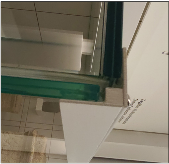
Detal mocowania zawiasu szyby