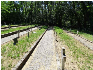
Chodnik przeznaczony do wymiany