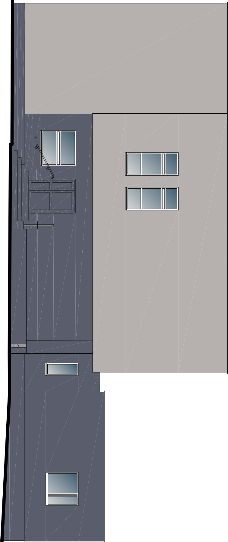
ELEWACJA BOCZNA- PÓŁNOCNO WSCHODNIA, skala 1:100