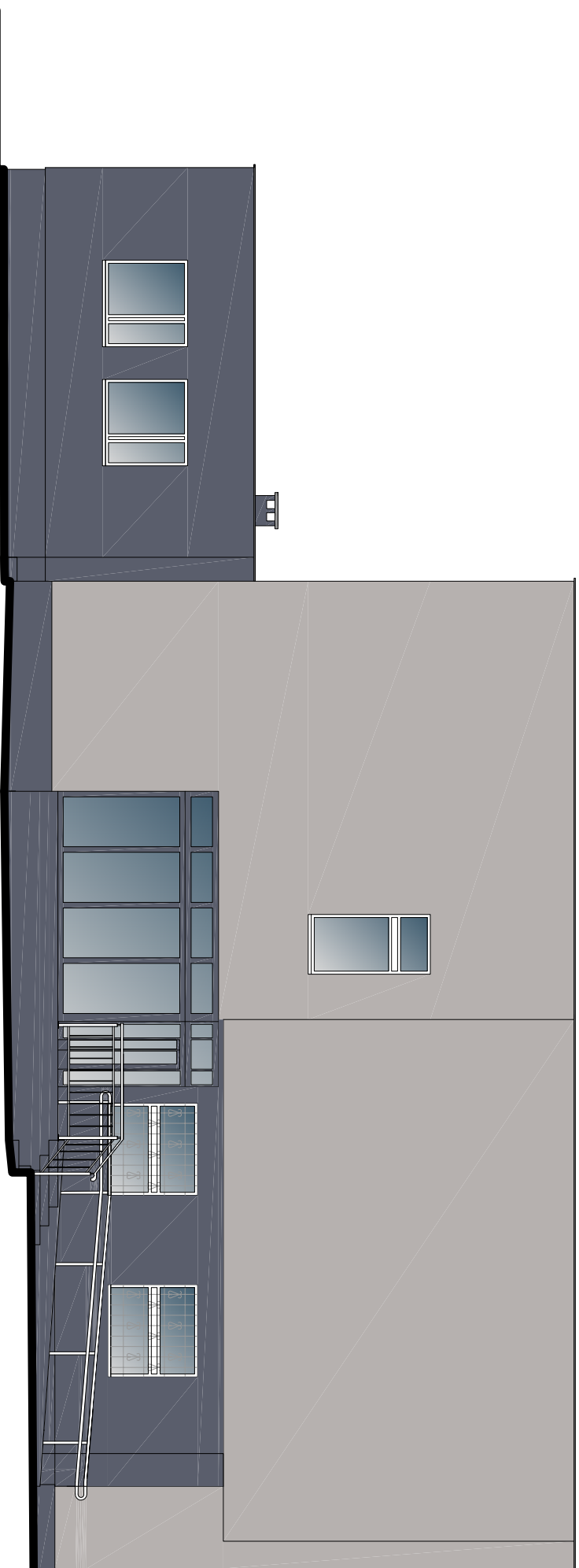
ELEWACJA BOCZNA- POŁUDNIOWO- ZACHODNIA, skala 1:100