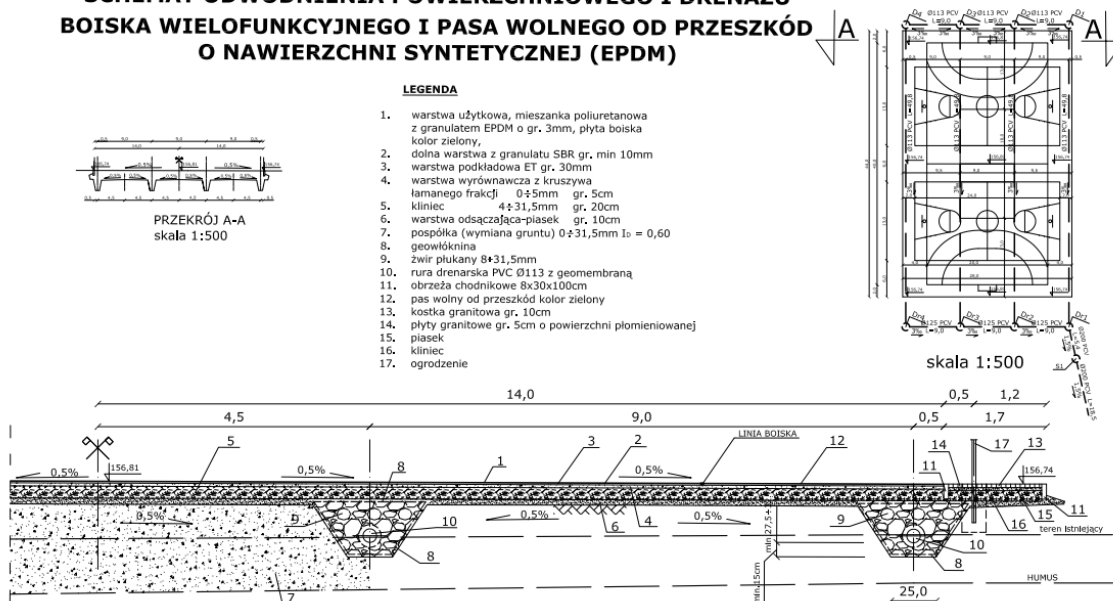
Rysunek 2 Przekrój przez warstwy boiska istniejącego