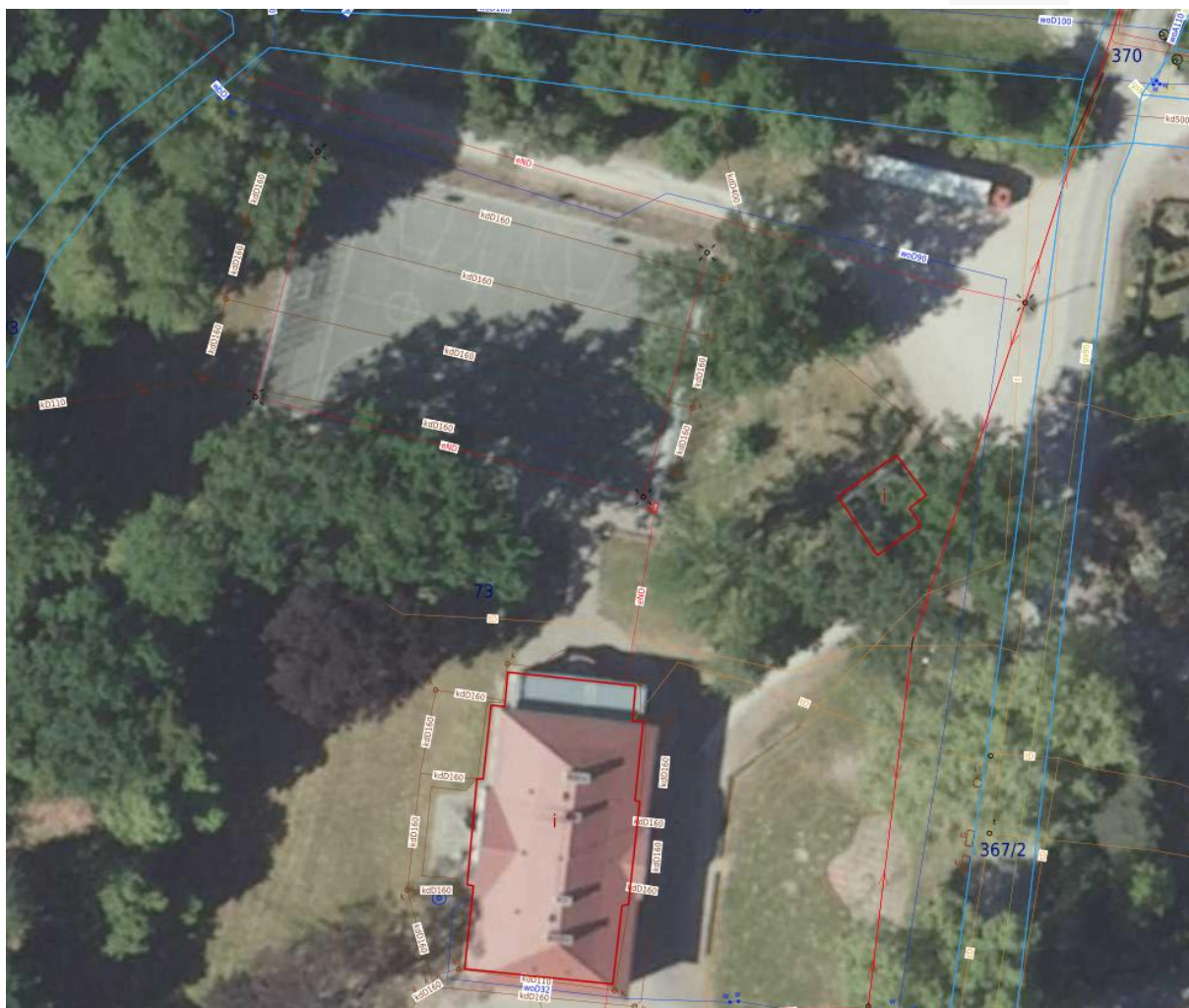
Fot 1 Ortomapa terenu objętego inwestycją- dz nr 73 obręb Wisznia Mała

Realizacja przedmiotu zamówienia będzie obejmować dwa etapy: