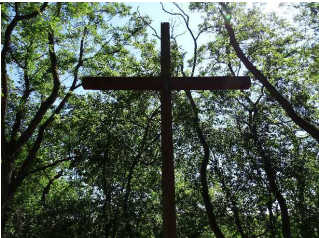
Krzyż przeznaczony do renowacji