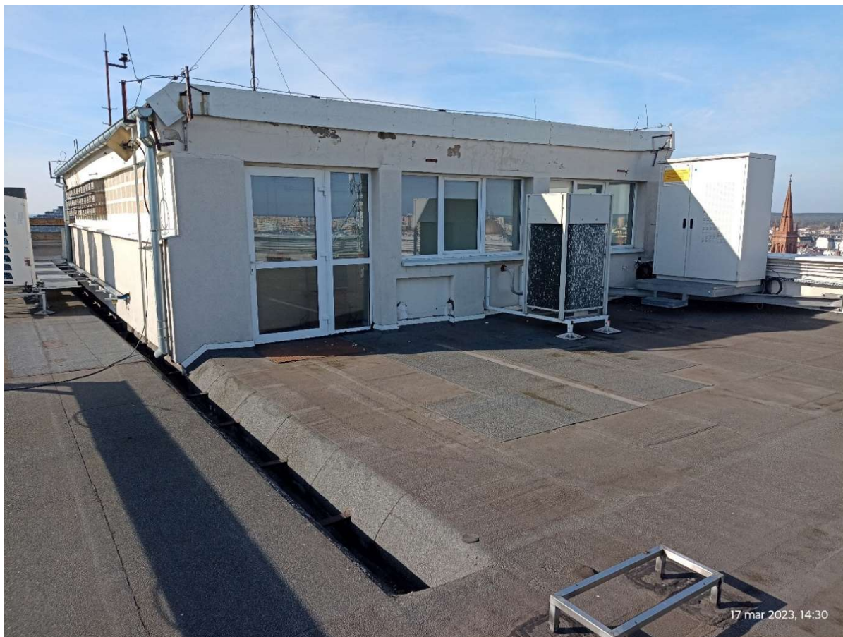
Fot.2. Nadbudowa ściany do remontu