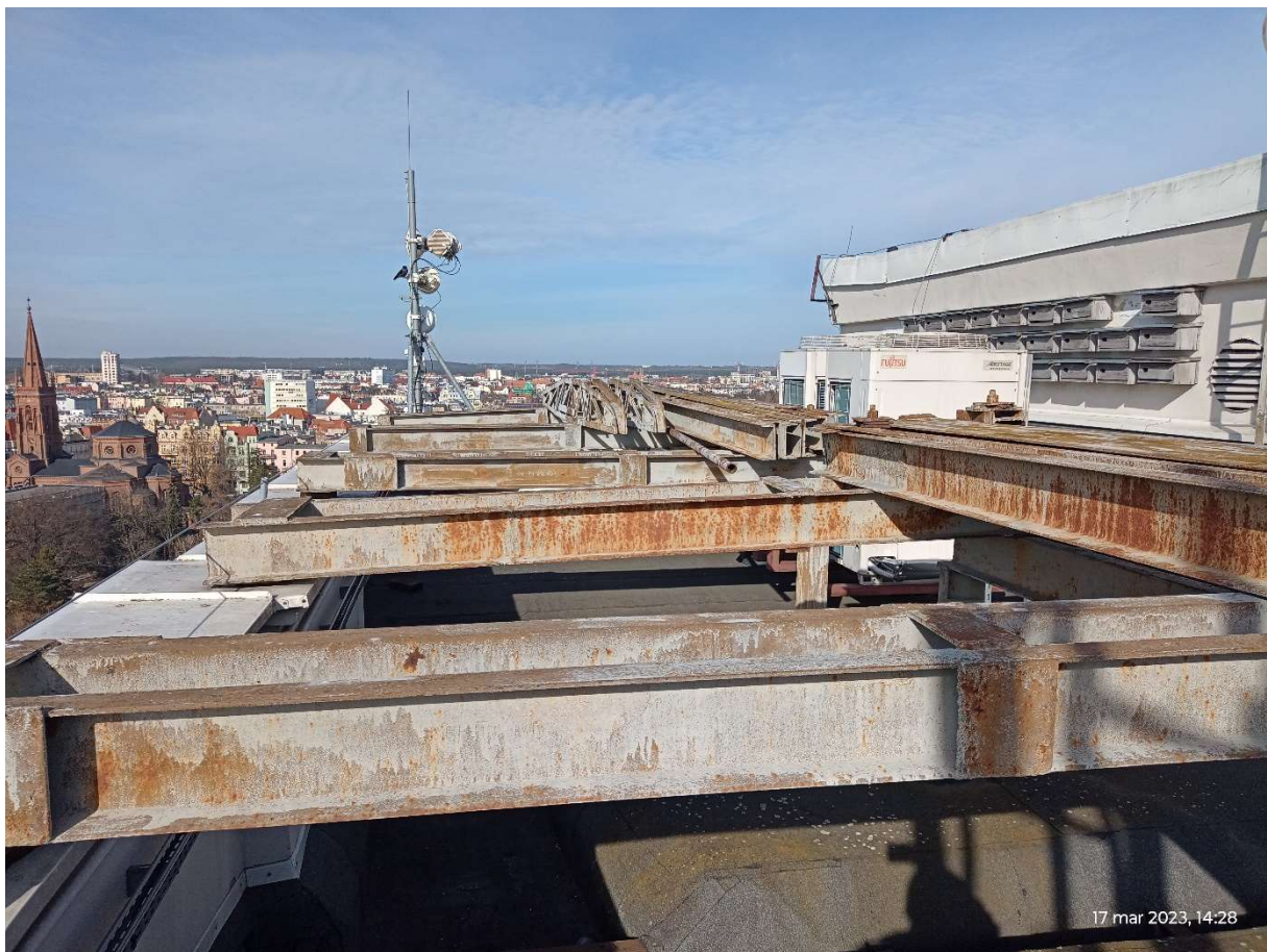
Fot.4. Konstrukcje stalowe do demontażu.