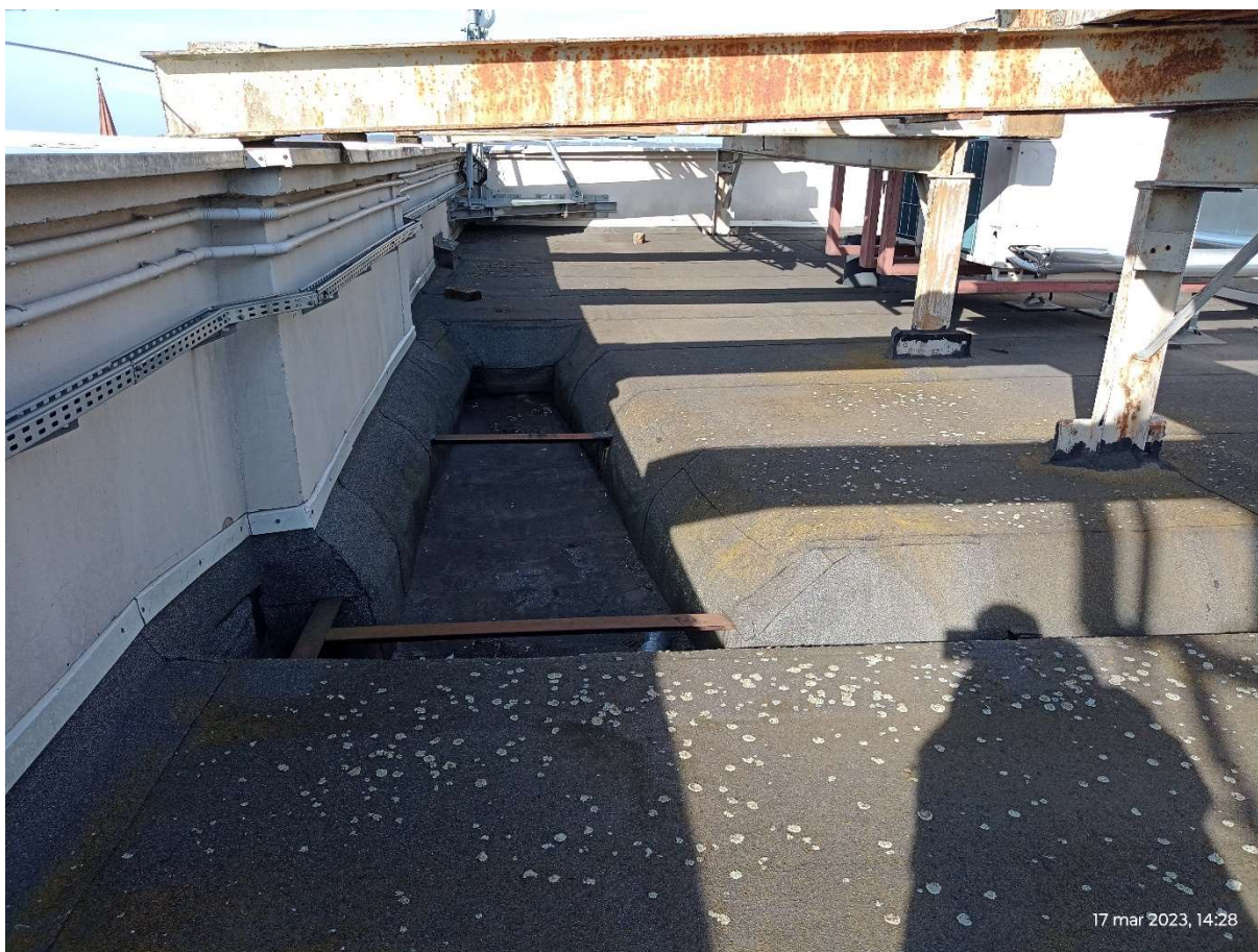
Fot.7. Koryto zlewowe