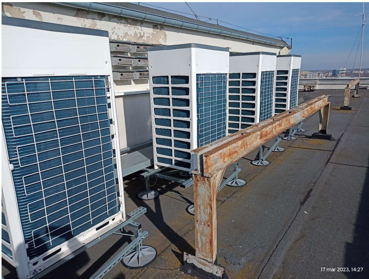
Fot.6. Urządzenia zlokalizowane na dachu.