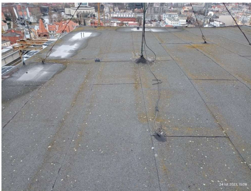
Fot.1. Pokrycie dachu - nadbudowa