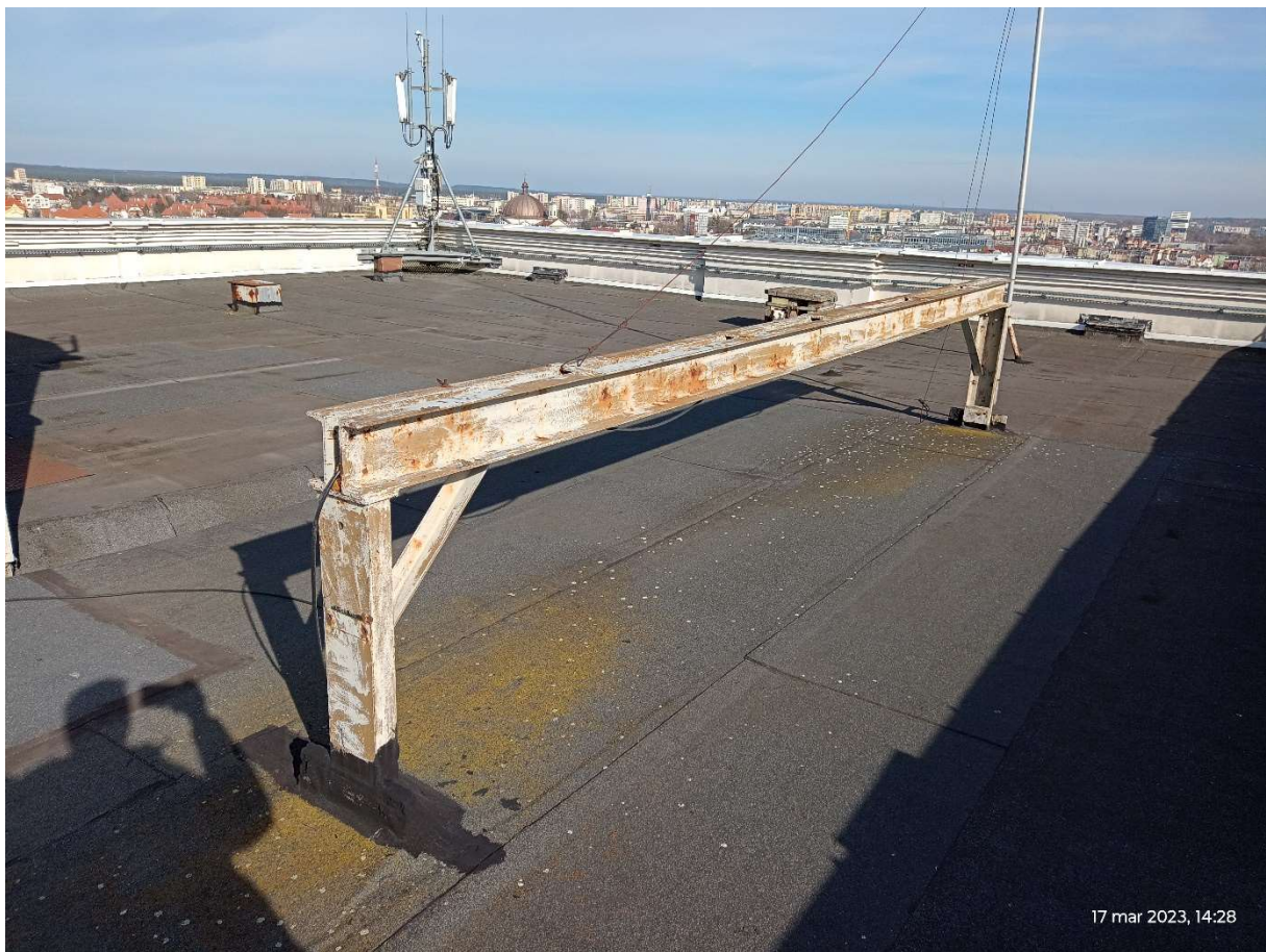
Fot.5. Konstrukcje stalowe do demontażu.