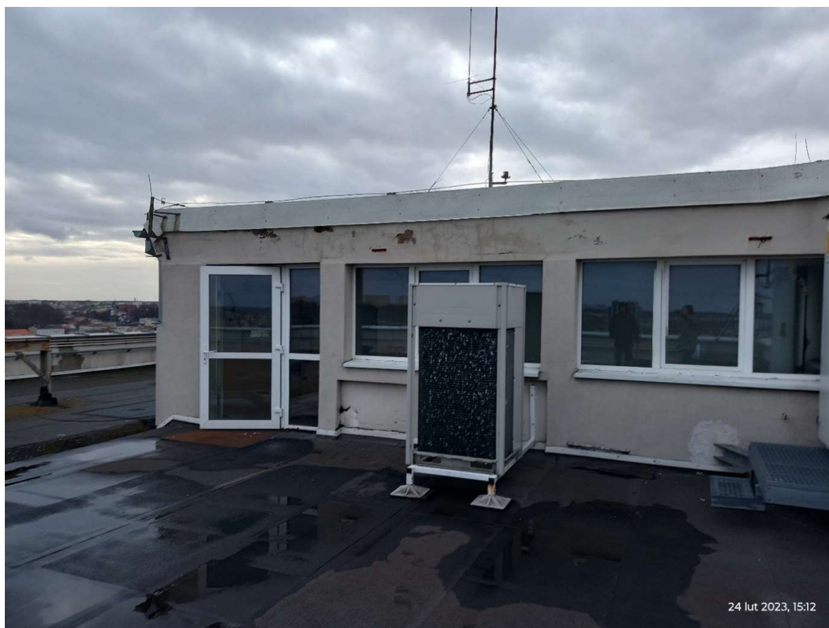
Fot.3. Nadbudowa – ściana do remontu