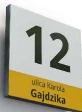
MODUŁ POWIĘKSZONY R1-P