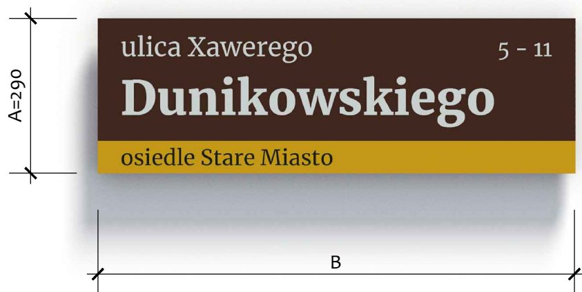
TABLICA ELEWACYJNA R2-E

Materiały: tablica na bazie profilu aluminiowego gr. 25mm, wyklejana zadrukowaną folią odblaskową drogową