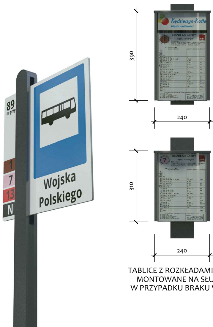
TABLICE Z ROZKŁADAMI JAZDY MONTOWANE NA SŁUPKU W PRZYPADKU BRAKU WIATY