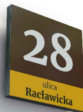
MODUŁ POWIĘKSZONY R1-P