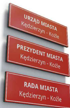
PRZYKŁADOWE TABLICE 1, 2 I 3-WERSOWE