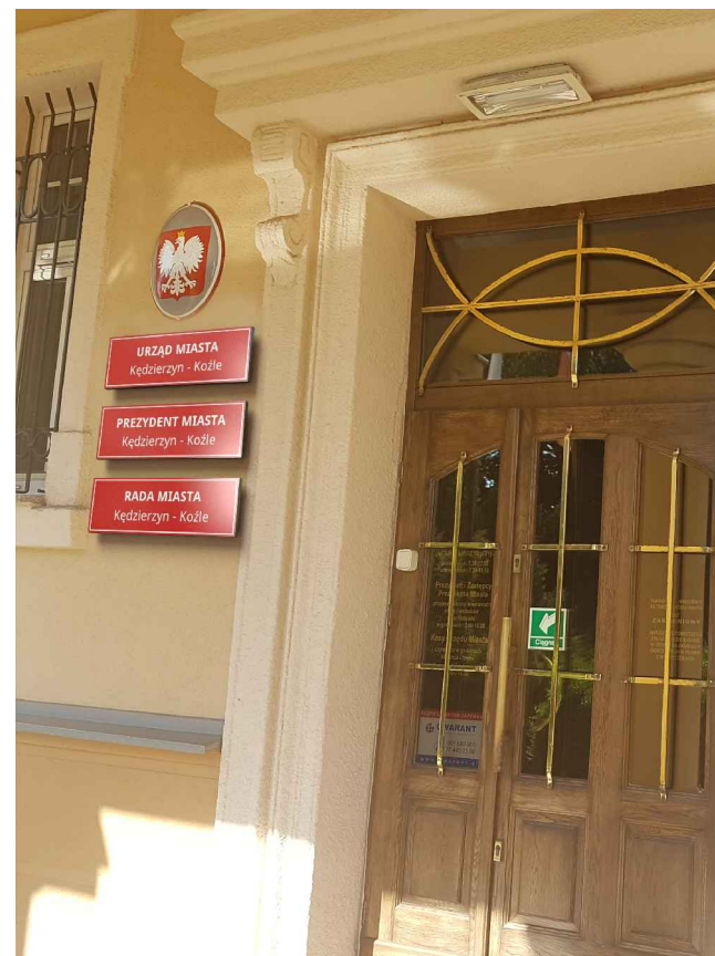
Projektowane rozmiary tablic [mm]: