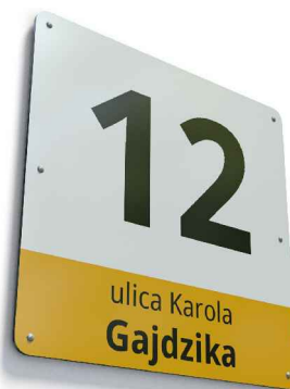
MODUŁ POWIĘKSZONY R1-P