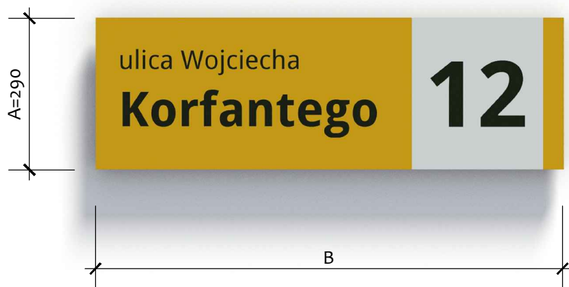
Projektowane rozmiary tablic [mm]: