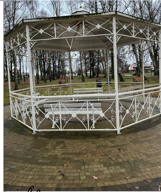
Projektowana lokalizacja altany (1)