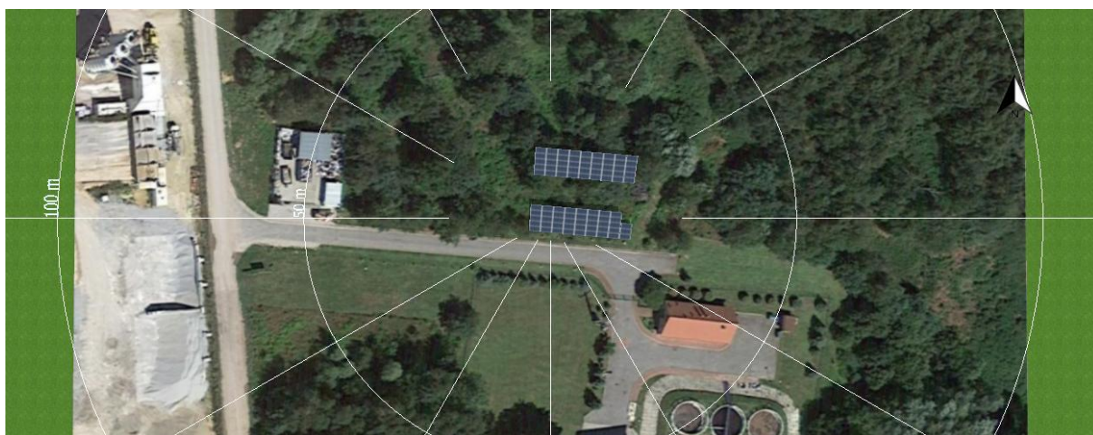
Fotografia 4. Proponowane rozmieszczenie modułów fotowoltaicznych (wizualizacja)

Miejskowy Plan Zagospodarowania Przestrzennego – mapa