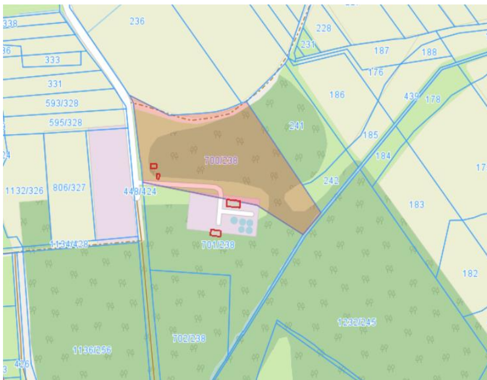
Fotografia 1. Lokalizacje inwestycji – Oczyszczalnia Ścieków w Woźnikach (nr działki)