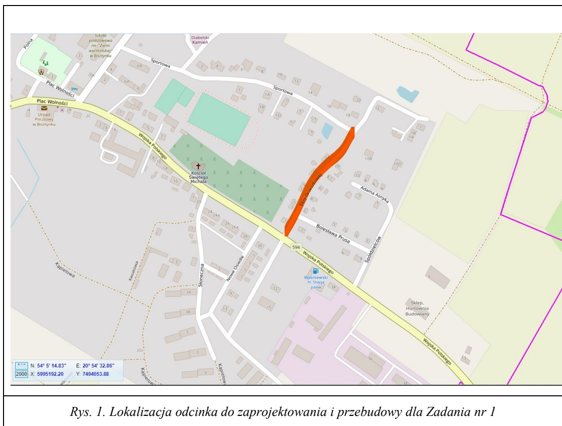
Rys. 1. Lokalizacja odcinka do zaprojektowania i przebudowy dla Zadania nr 1

przewidzianej do przebudowy w ramach Zadania nr 2.